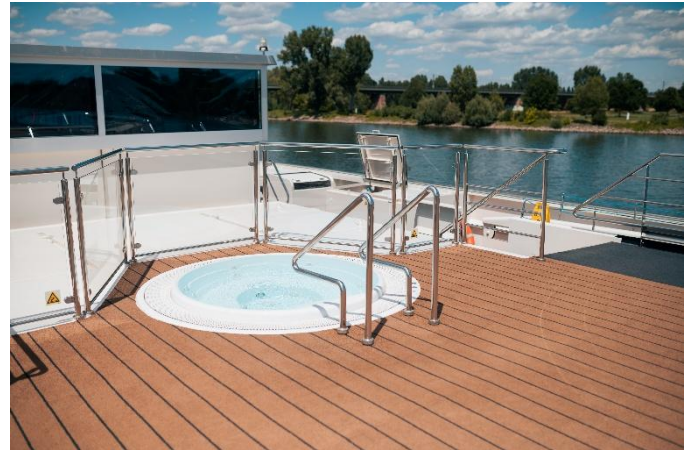
MS Charles Dickens, Oberdeck

Es gelten die verbindlichen allg. Geschäftsbedingungen der neuesten Fassung. Alle Preisangaben sind in Euro und gelten pro Person. Preis- und Programmänderungen vorbehalten. Tippfehler vorbehalten! Mindestteilnehmerzahlen: Kreuzfahrt 130 Personen je Termin, Ausflugspaket 20 Personen je Termin. © Copyright – Alle Fotos sind urheberrechtlich geschützt und sind nicht zur Weiterverwendung gedacht. Veranstalter: GSW Touristik AG. Bitte beachten Sie die Geschäftsbedingungen unter www.gta.at/geschaeftsbedingungen/