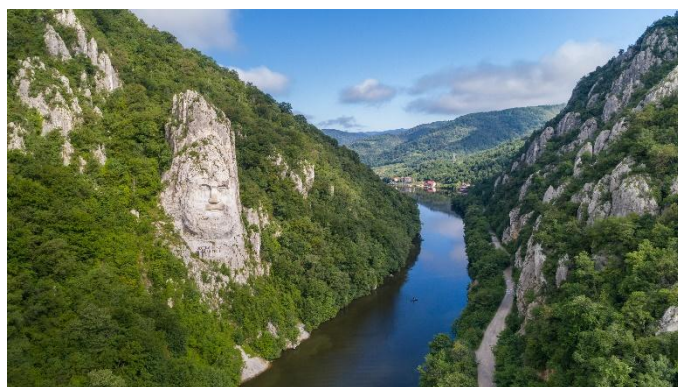
Eisernes Tor, Decebal

In der Früh erreichen wir Wien-Nußdorf. Nach einem letzten Frühstück sagen wir der MS Charles Dickens Lebewohl und treten die Heimreise an.