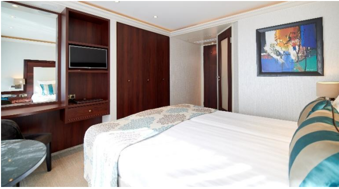
MS Charles Dickens, Doppelkabine Mittel-/Oberdeck