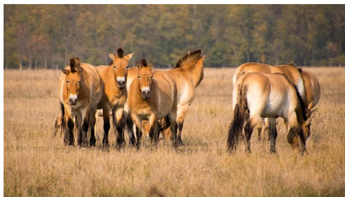
Wildpferde in der Puszta