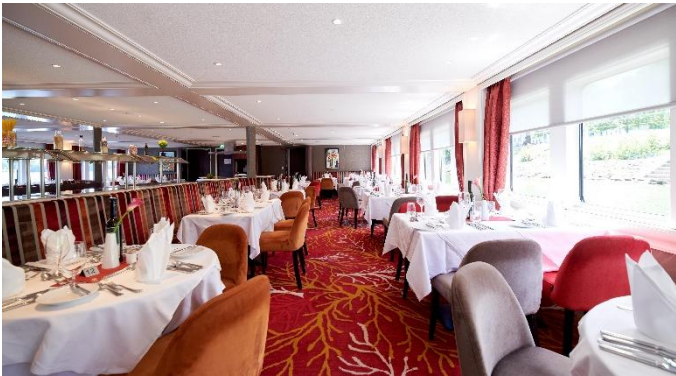
MS Charles Dickens, Restaurant